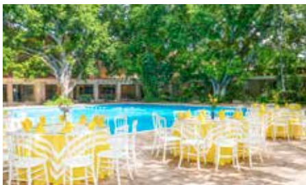
Alberca, con área para niños, jacuzzis, amplias terrazas y jardines.